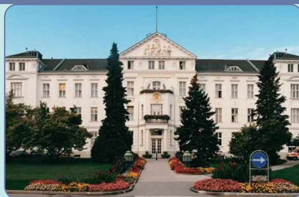
Gartenhotel Altmannsdorf & Krankenhaus Hietzing